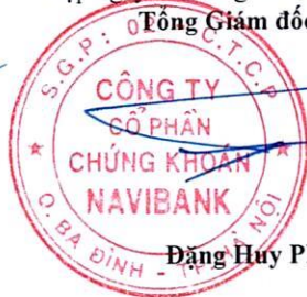
Đặng Huy Phong