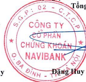
Đặng Huy Phong